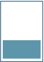
1/3 Seite quer