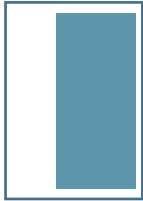
2/3 Seite hoch