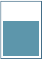
2/3 Seite quer